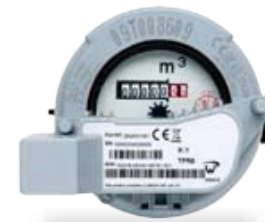
slimme draadloze volume watermeter