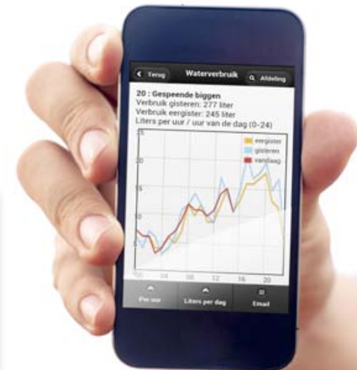
Grafiek met het waterverbruik in liters per uur over meerdere dagen.